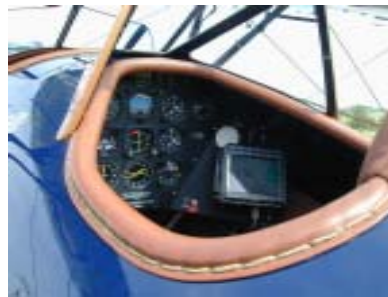
MT-Ultra in the cockpit of Boeing Stearman PT 17

The picture, showing him in front of the Boeing Stearman PT17 was taken in August this year during a stop of the clubs fleet of five PT 17's at Kempten APT, the new homebase of Moving Terrain.